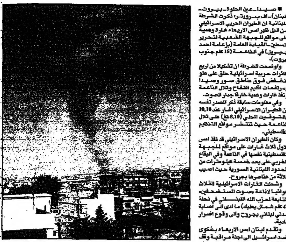
المدن يتصدد من محطة «أمانة المستوطنين» التي يديرها حزب الله في بعلبك بعد الغارة الإسرائيلية أمس الأول (رويتز)

صيدا - عين الحلوة - بيروت - لبنان) - في انفجار عبوة ناسفة كان يحملها، كما اطلقت النار في المخيم، من قبل طائرته الحربية الإسرائيلية، شن قبل ظهر أمس الأربعاء غارة وهامية على مواقع للجبهة الشعبية لتحرير فلسطين - القيادة العامة (زعامة أحمد جبريل) في الناصرة (15 كلم جنوب بيروت). وأوضحت الشرطة أن تفجيرها من أربع عاثرات حربية إسرائيلية حلق على علو منخفض فوق مناطق صيدا وصيدا ومرمقعات اقيم للفلاح وتلال الناعمة ونفخ غارات وهامية خارجا جدار الصوت. وفي معلومات سابقة نشر لصدر نفسه ان الطيران الإسرائيلي اغار عند 10.10 بتوقيت المحلي (8.10) على ليل في الناصرة حيث تنتشر مواقع التنظيم الفلسطيني. وكان الطيران الإسرائيلي قد نفذ منذ الاول ثلاث غارات على مواقع للجبهة الشعبية لضحايا في الناصرة وفي الغارات على بعد خمسة كيلومترات من الحدود اللبنانية السورية حيث اصيب ثلثة من عناصرها بجروح. وشملت الغارات الإسرائيلية الثلاث هوائيا ثلاثة صواريخ المستوطنين التابعة لحزب الله اللبناني في حلة (4 كلم شمال بعلبك) ما أدى إلى إصابة مدني لبناني بجروح وإلى وقوع اضرار مادية. وتقدم لبنان أمس الأربعاء بشكوى ضد إسرائيل إلى لجنة مراقبة وقف إطلاق النار في جنيف لبنان بفسان غاراتها الجوية أمس الأول على سهل البقاع.